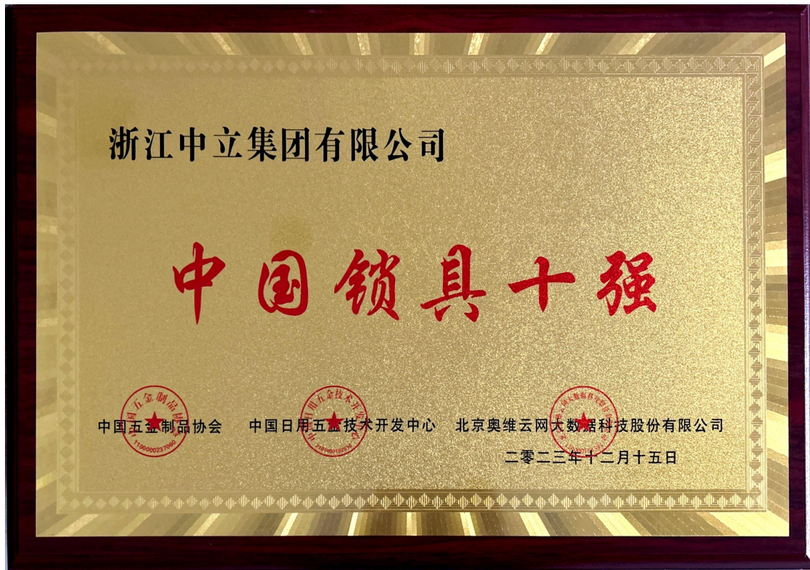
图 3 中国锁具十强