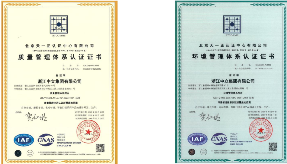
图 1 质量和环境管理体系证书

公司通过 ISO 19001 质量管理体系认证，ISO 14001 环境管理体系和 ISO 45001 职业健康安全管理体系。公司检测中心通过中国合格评定国家认可委员会（CNAS）认可。证书都在有效期内。