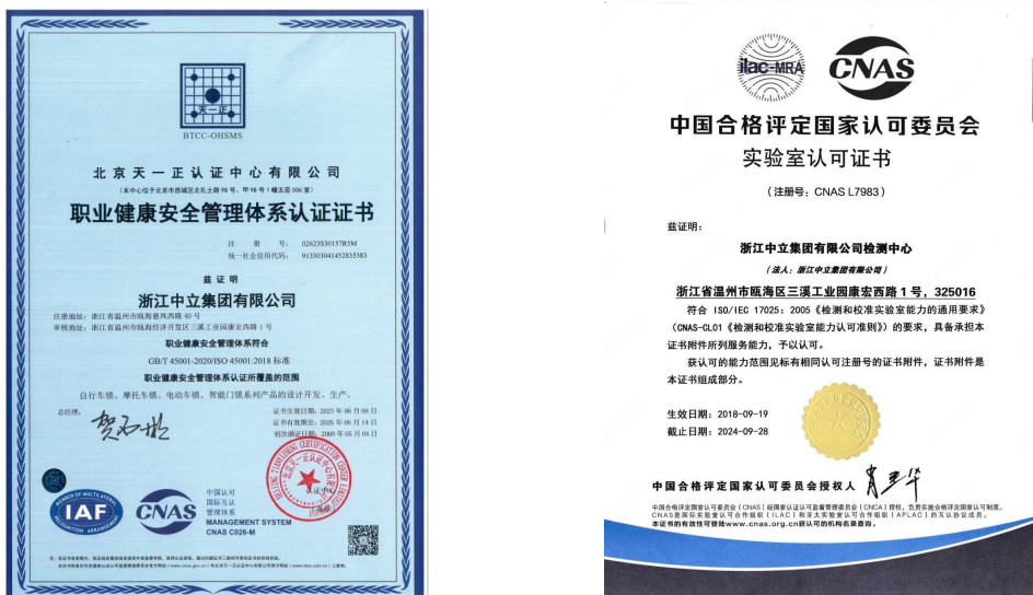
图 2 职业健康体系证书、实验室认可证书